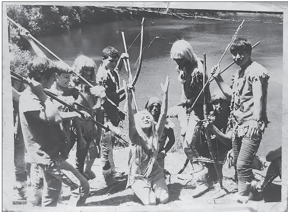
На съёмках фильма «Земля Санникова»

Значительную часть знаменитого фильма снимали в нашей республике